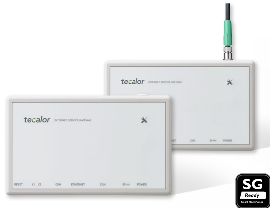
ISG und ISG plus